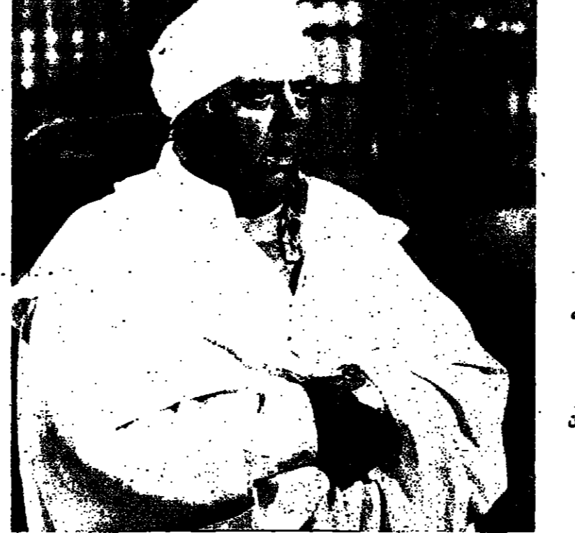
زعيرت بر ( ينظر مسلسل ايونيسايك ) كما تراه في دوره كتاجر اثريات مصري في فيلم « الفتحة توت غنغ امون » ... التلفزيون الاسرائيلي - العائنة والزرع ليلا ..

الفتحة توت غنغ امون ١. بقلم الصحفيين الاسرائيلي ٢. الفتحة توت غنغ امون